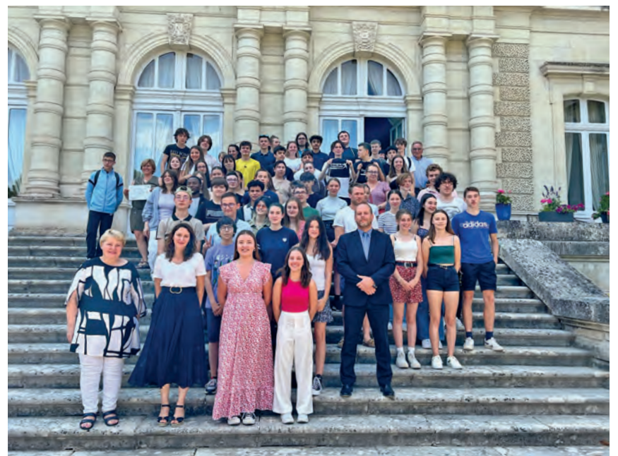
Remise des prix sur le perron de la préfecture

Près de 8 000 élèves en Aquitaine ont participé à cette épreuve le 13 mars dernier, ce qui représente 320 classes et autour de 1000 élèves soit 40 classes en Dordogne.