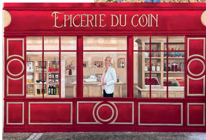
▲ Nouvelle fresque réalisée par Christophe Boucher sur le mur de l'épicerie ouverte depuis quelques mois sur la place des Sabotiers.