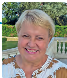
Paulette DOYOTTE Maire de Neuvic