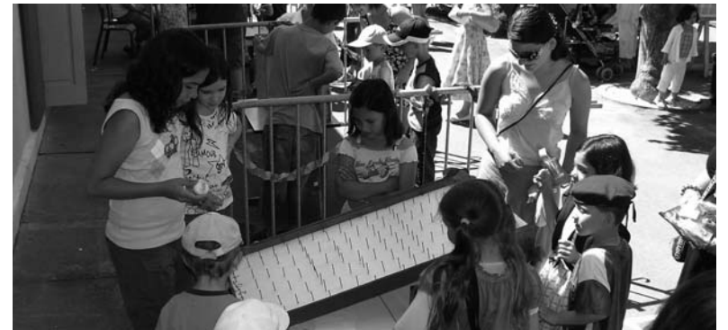
Quelques images d'une fête de fin d'année scolaire, réussie.