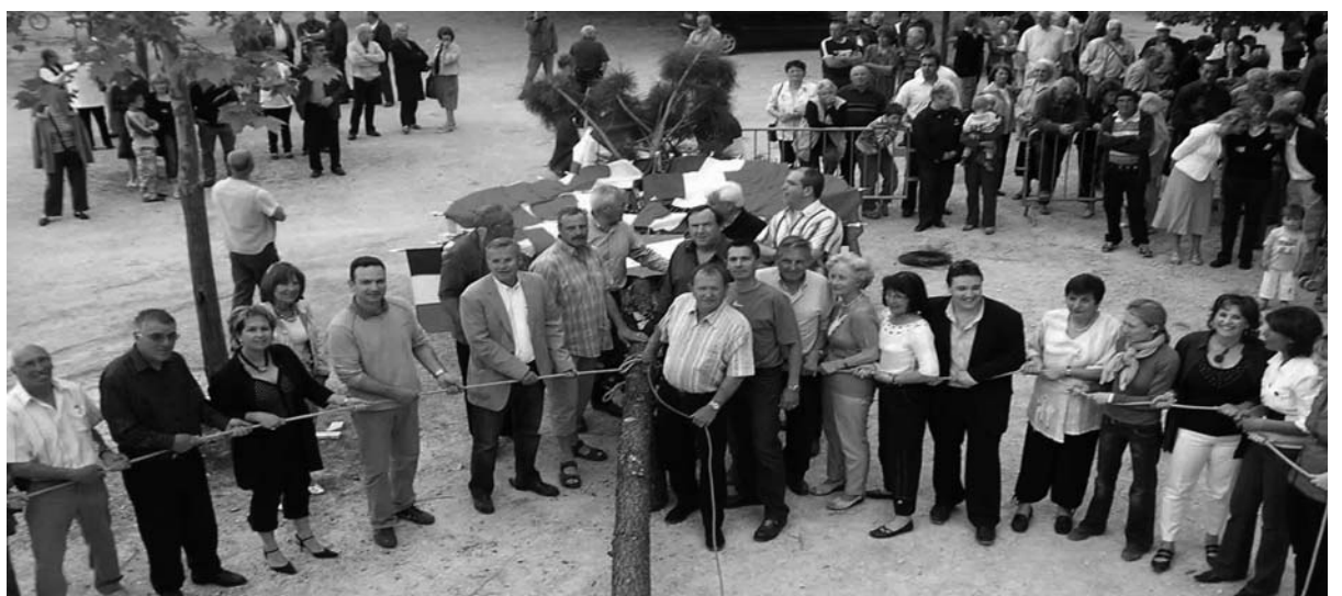
Après la plantation d'un magnifique pin maritime orné d'une centaine de drapeaux bleu-blanc-rouge, la fête s'est poursuivie tard dans la soirée.