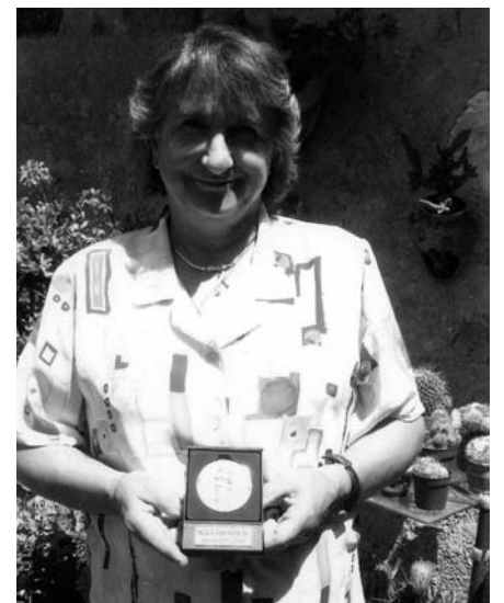
Médaille d'argent du Périgord Agenais, pour récompenser sa fidélité au Club.... Cette grande cuisinière que tout le monde nous envie.